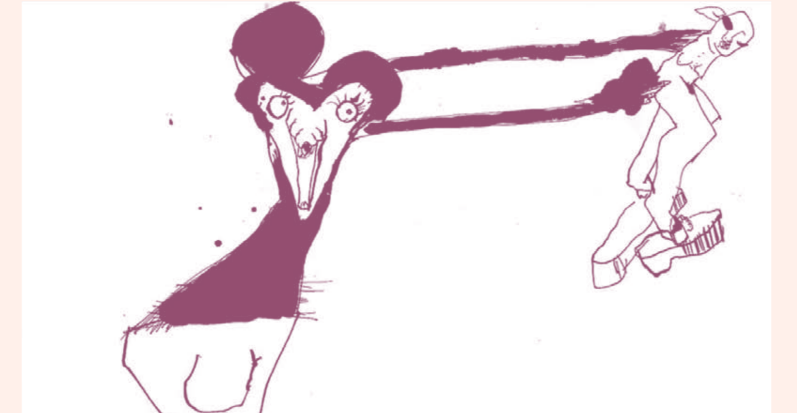
UNA FOSSA COMÚN

COMO UN SOLO HOMBRE (COMME UN SEUL HOMME). Dir. Denis Dzarcq. 2015. Francia.