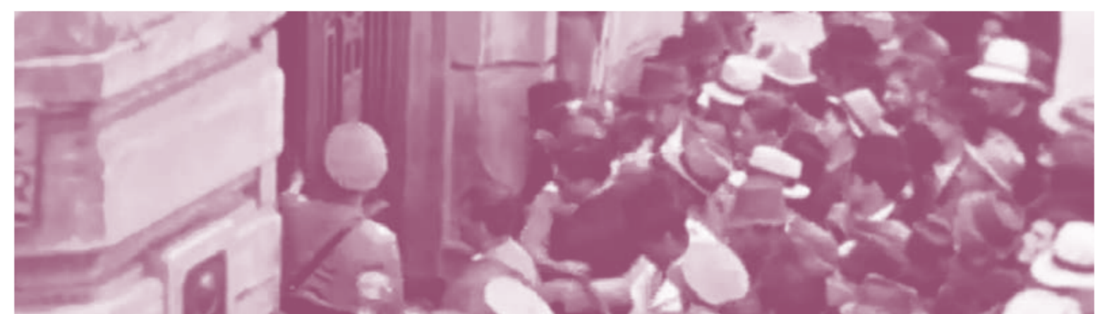
CESÓ LA HORRIBLE NOCHE