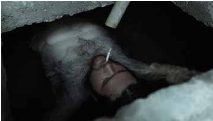
Dile a ella que me vio llorar