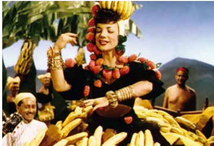
Carmen Miranda: Bananas is My Business