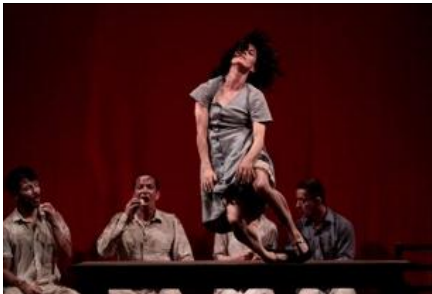
La Mirada del avestruz - Compañía L'Explose

En este taller se incluirán ejercicios de fuerza, flexibilidad, movilidad, equilibrio y control, por medio de métodos funcionales de entrenamiento y la ayuda de técnicas como el Pilates, yoga dinámico y elementos externos como las bandas elásticas. El objetivo es brindar la posibilidad a los participantes que comprendan qué, como y para qué aplicar rutinas de entrenamiento y además puedan desarrollar sus propias rutinas adaptándolas a la necesidad de su entrenamiento u oficio.