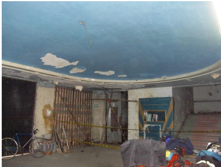
Acceso – foyer del teatro el cual, se encuentra en deplorables condiciones.