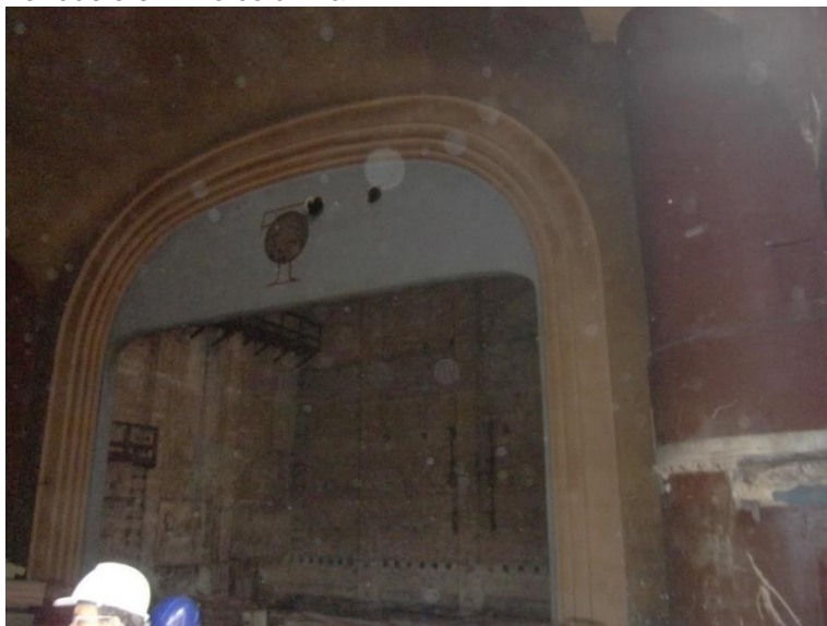
Vista del área donde se ubicaba el escenario y que en la actualidad no cuenta con ningún elemento para su adecuada utilización.