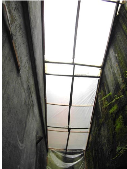
Sector lateral objeto de primeros auxilios con la cubierta de polietileno instalada por la entidad.