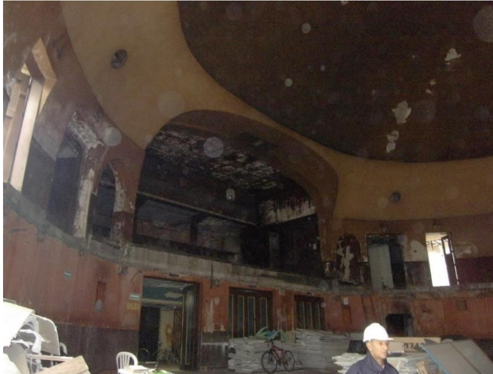
Vista del interior de la sala del teatro, a la cual le fue demolida el sector de palcos o mezzanine que alguna vez lo caracterizó y que en el momento es un depósito o bodega de materiales del IDARTES.

Fachada lateral del teatro que correspondía a en tiempos anteriores a culata contra otra edificación.