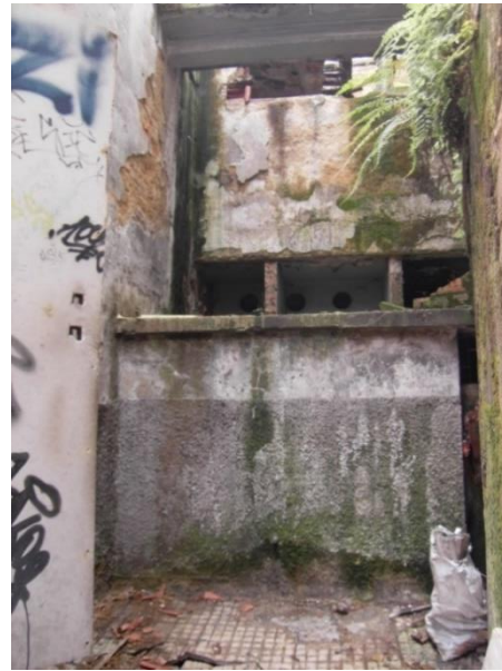
Áreas laterales del teatro en completo abandono.