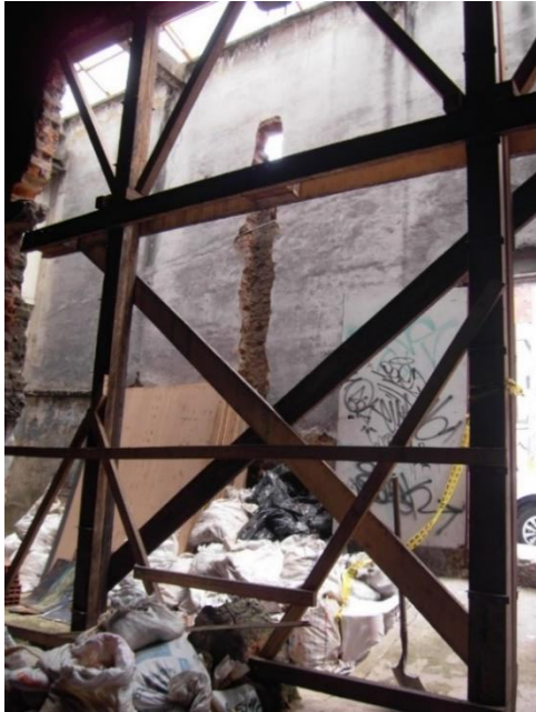
Dentro de las dos actividades de primeros auxilios a este BIC se encuentra el apuntalamiento con estructura de madera, en área donde anterior duelo eliminó columna.