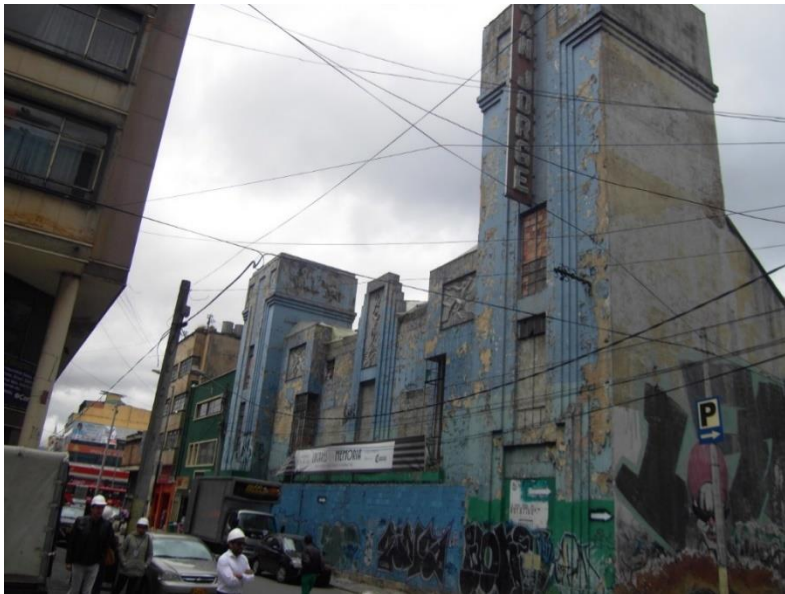
Fachada principal del Teatro, estilo Art Decó en avanzado estado de deterioro.

TEATRO SAN JORGE DIRECCIÓN: CARRERA 15 No. 13-63 – LOCALIDAD DE LOS MÁRTIRES